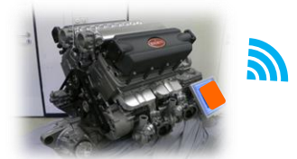
動機器点検、設備管理