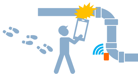
機器の騒音、配管腐食監視